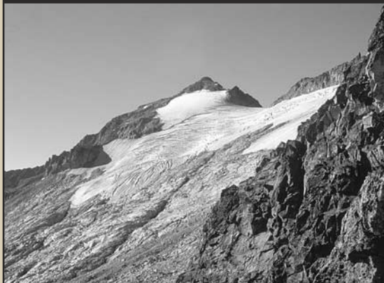
El Aneto aparece de pronto al alcanzar el Portillón Inferior.